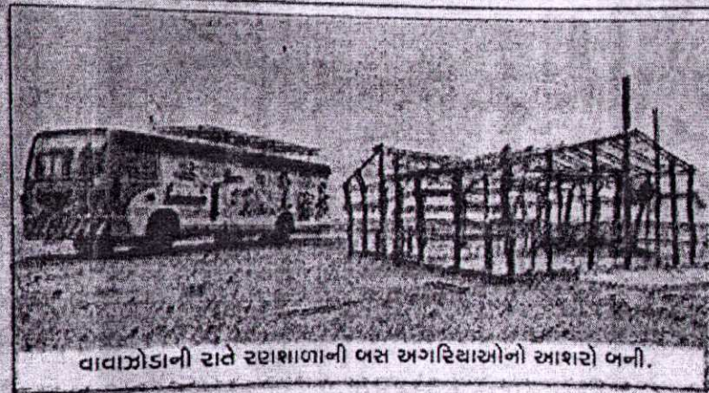
વાવાઝોડાની રાતે રણાણાણાની ભસ અગરિયાઓનો આશરો બની.

મીઠાંની સીઝન હવે અંતિમ તબક્કામાં છે. આશરે સાડા નવ લાખ