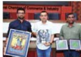
નવગુજરાત સમય > રામદાસ

ગુજરાત ચેમ્બર ઓફ કોમર્સ એન્ડ ઇન્ડસ્ટ્રી (GCCI)ની યુથ વિંગ અને Abacus-The Academyએ આસ્યા ચેરિટિવ ટ્રસ્ટ દ્વારા સંસ્થાના આનંદધામ માટે બંધાયેલ એકન કરવા માટે રવિવારે ચેરિટી ઓક્શનનું આયોજન કર્યું હતું. શૈક્ષિક વિહારાંગ વ્યક્તિઓને સંબંધ અને સહાય પૂરી પાડવા માટે ટ્રસ્ટના પ્રયાસોને સમર્થન આપવા માટે ₹ 1,90 લાખનું ધન એકત્ર કર્યું હતું. ઓક્શનમાં ધંધ મેનેજર્સ પ્રોક્ષામ