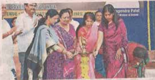
Union Minister Darshana Jardosh inaugurates a three-day handloom expo event in Surat on Saturday.

"About 1,500 cases related to TUF are pending. We have done special programmes related to