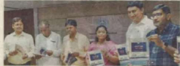
AMC launched info booklet about details of property tax structure

Rate will be at factor 2, same as factory itself